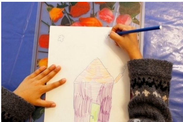
L'étude se base notamment sur la qualité de l'habitation et le nombre de personnes qui vivaient sous le même toit.

Une étude de l'Université de Genève montre que les enfants ayant évolué dans un contexte socio-économique difficile ont une santé plus chancelante à l'âge adulte.