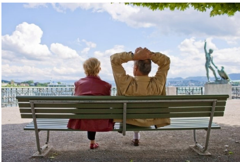
Les Suisses ne sont pas égaux face à la vieillesse.

Santé Si les Helvètes ont gagné plusieurs années d'espérance de vie, ils ne sont pas toujours en meilleure santé, en particulier chez les personnes sans formation supérieure.