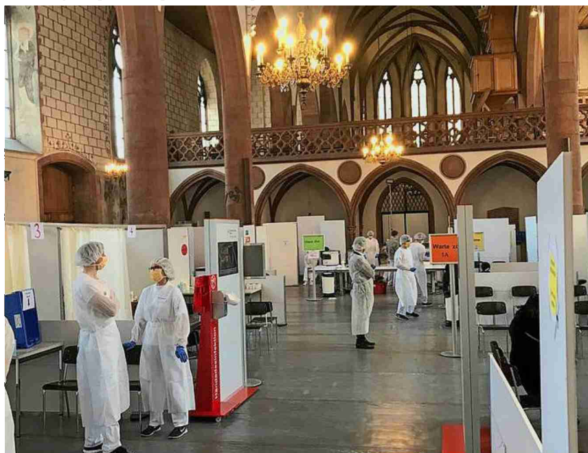
La Predigerkirche de Bâle a accueilli des tests de dépistage du Covid lors de la première vague.