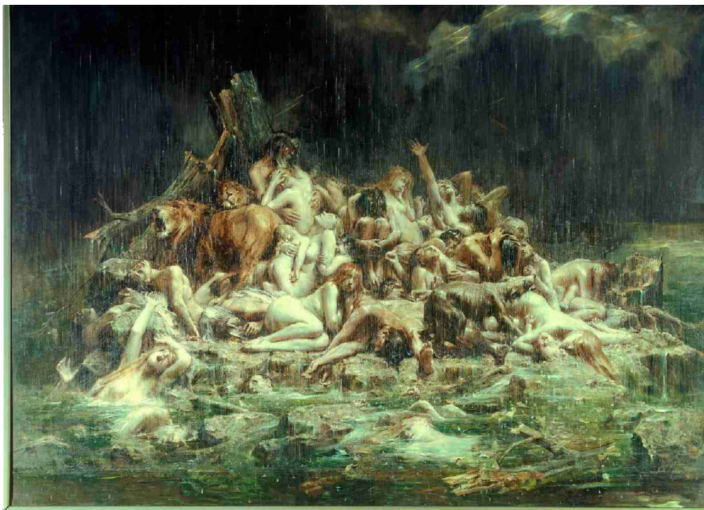
«Le déluge» de Léon- François Comerre, allégorie des calamités qui peuvent frapper l'humanité.